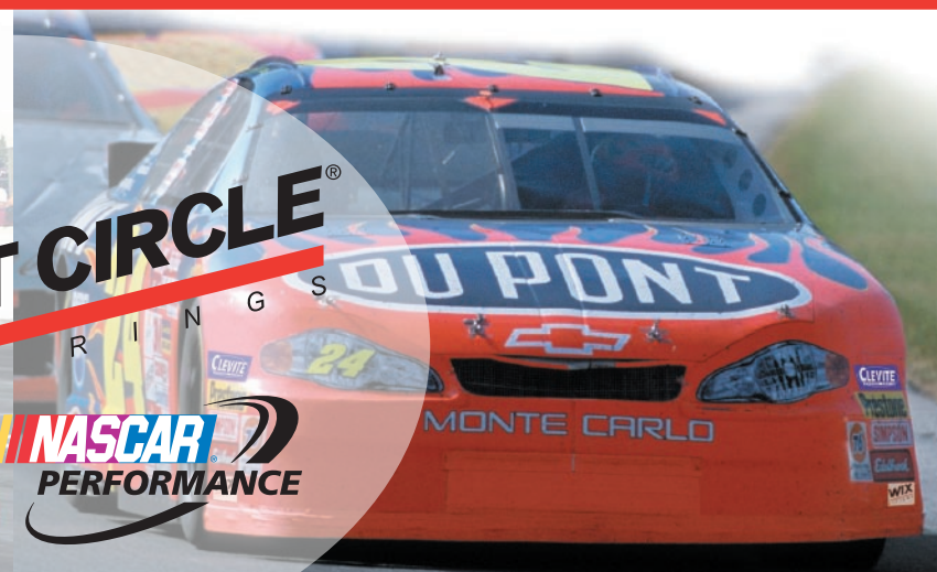
El cuatro veces campeón por puntos en la categoría NASCAR, Jeff Gordon, integrante del equipo Hendrick Motorsport.