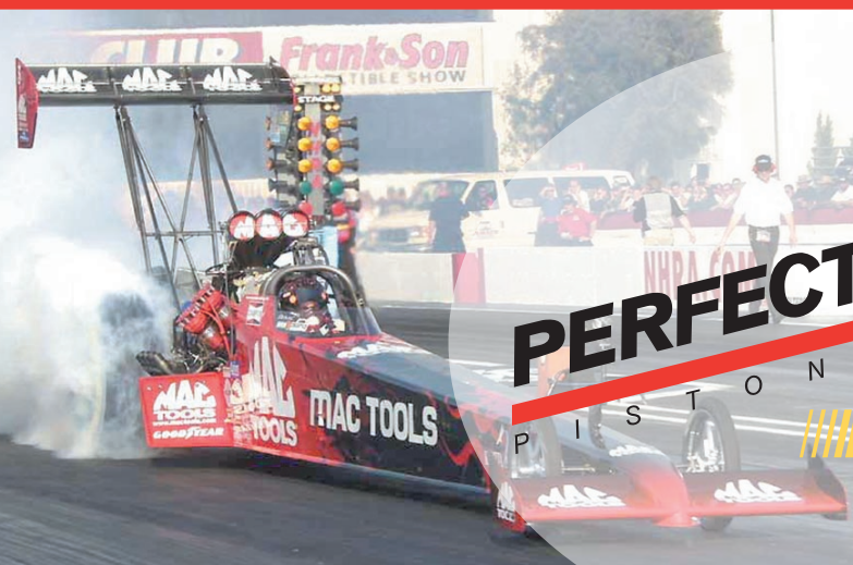
Doug Kalitta en su MAC Tools Dragster, ostenta el record de velocidad en el 1/4 milla de la categoría Top Fuel (333.91 mph) en la NHRA.

Perfect Circle es la marca elegida por los ganadores de todas las carreras de autos de alta competición.